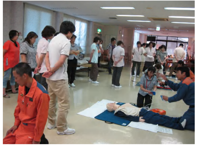
参加者全員、真剣に実践し、汗びっしょりでした。

「心室細動」を起こした人に対しては、早期に心肺蘇生法とAEDを用いた電気ショック（除細動）を行うことが、救命率アップにつながります。いざという時、今回の研修の経験を活かして、慌てず安全確実に救命処置が行えるように職員一同取り組んでまいります。